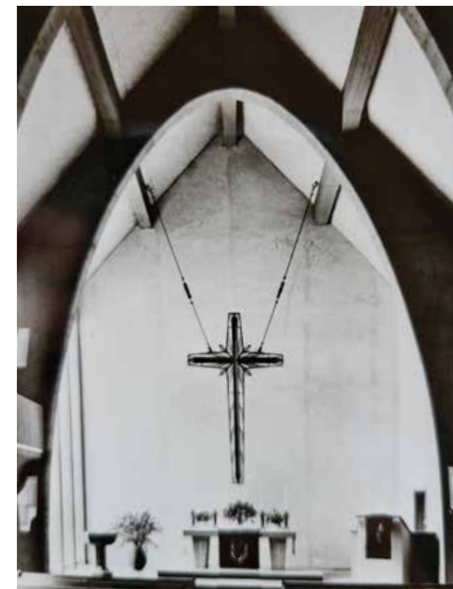
Der Innenraum der alten Kreuzkirche.

Die Freude über das Jubiläum der Kreuzkirche wurde dadurch getrübt, dass es schon seit Anfang der 1960er Jahre Pläne für eine umfassende bauliche Umgestaltung der Ortsmitte von Wesseling gab. Die Bonner Straße war nämlich damals zugleich die Bundesstraße 9 und führte den gesamten Verkehr zwischen Köln und Bonn, der nicht die Autobahn befuhr, mitten durch Wesseling hindurch. Daher plante man, die B9 zu verlegen und dafür die evangelische Kirche abzureißen. Pünktlich zur Jubiläumsfeier waren diese Pläne zwar wieder in den Schubladen der Behörden verschwunden. Doch das Presbyterium war sich der Tatsache bewusst, dass