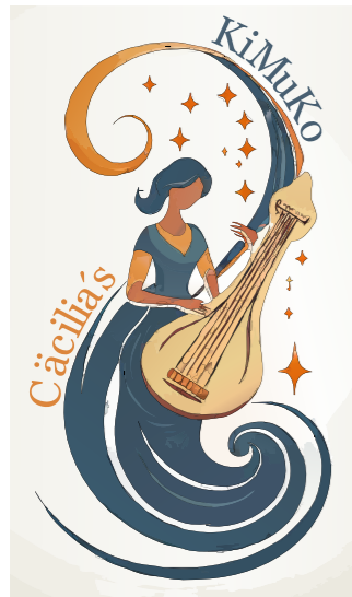
Grafik: Thomas Jung, unter Verwendung von KI (Midjourney)

Manchmal hängt die Entwicklung der Geschichte an Details. Oder an den Persönlichkeitsprofilen Einzelner. Wie würde es sich anfühlen, wenn man auf einem Lichtstrahl reisen würde? Für die meisten kaum mehr als eine verschrobene Scherzfrage. Für einen Herrn namens Einstein nicht. Der