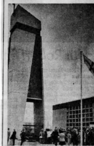
Neues Wahrzeichen: Der Glockenturm

dst. Wesseling. Am Sonntagvormittag um 10 Uhr war es endlich soweit. Das neue Gemeindezentrum der evangelischen Pfarrgemeinde Wesseling, die in den letzten Jahren auf über 3000 Mitglieder angewachsen ist, wurde mit einem feierlichen Festgottesdienst seiner Bestimmung übergeben.