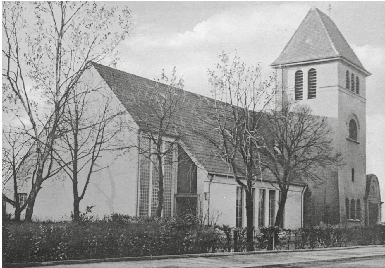
Die alte Kreuzkirche an der Bonner Straße.

sich die Pläne dadurch keineswegs erledigt hatten.