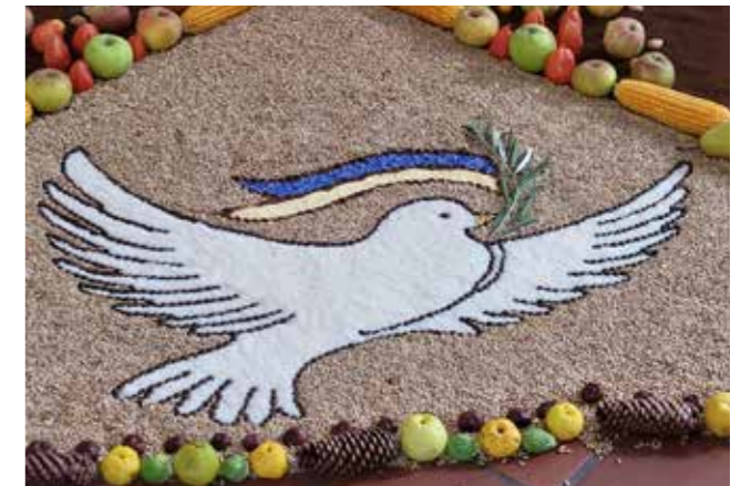
Eine aus Reiskörnern und Kaffeebohnen gelegte Friedens-taube mit der Ukrainischen Flagge im Schnabel

Der christliche Glaube sieht in all diesen Produkten Gott als den Schöpfer und Erhalter seiner Schöpfung am Werk. In seinem wundervollen Lied „Wir pflügen und wir streuen den Samen auf das Land“