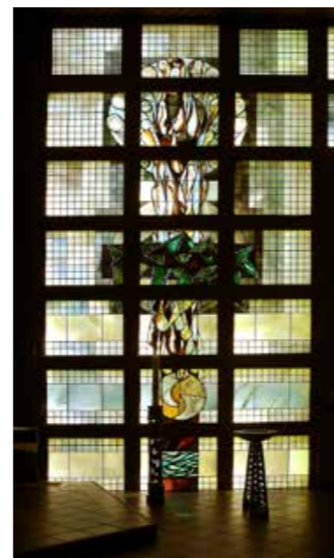
Das als „Baum des Lebens“ gestaltete Kirchenfenster