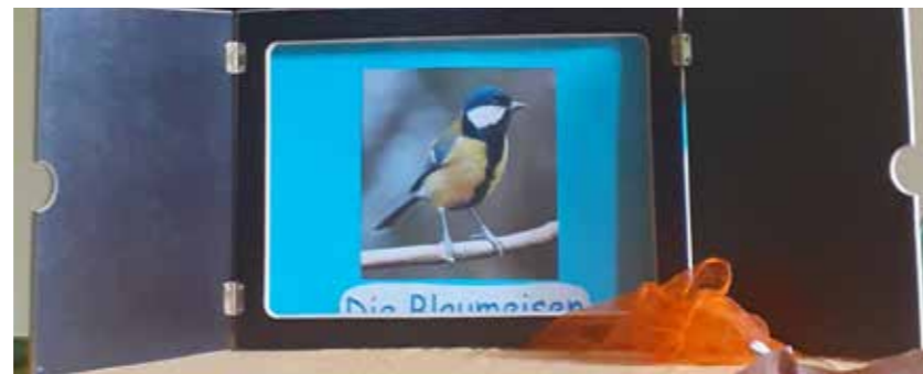
... und Blaumeisen.