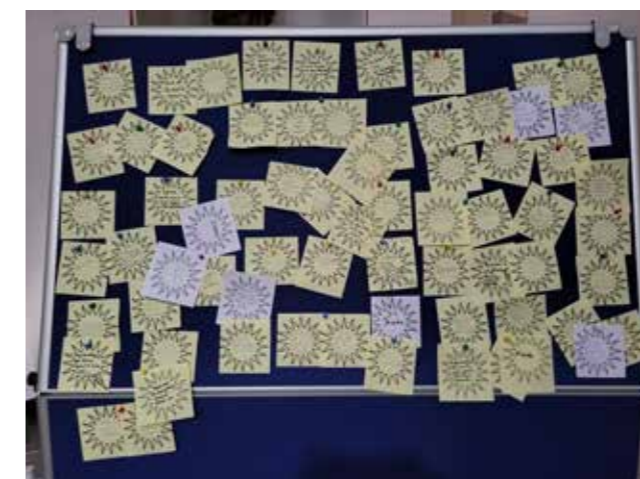
Viele Fürbitten wurden auf der Stellwand platziert.