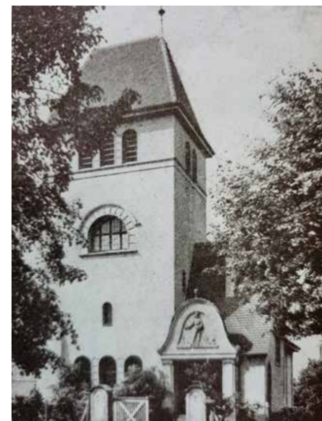
Der Kirchturm der alten Kreuzkirche.